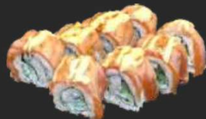
118. Aburi Sake Uramaki D,G,C 10,9€ Gurke, Avocado, Frischkäse, flambierter Lachs, Mayo 12