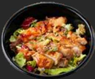
104. Chicken Teriyaki Don A, F, K