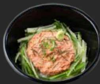
105. Spicy Tuna Don C, D, G, K

gegrilltes Hähnchen auf frischem Salatbett