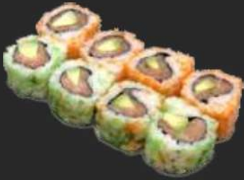
111. Sake Avocado Uramaki D,C 8,9€ Lachs, Avocado, Rogen