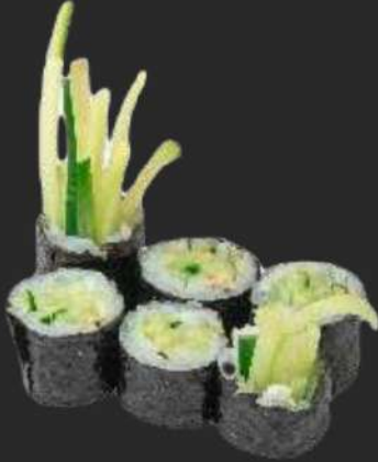
121.Kappa Maki K