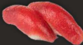
94. MAGURO D