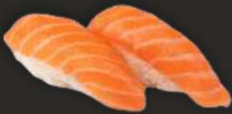
93. SAKE D