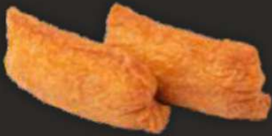
90. INARI F