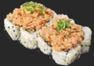
113. Spicy Tuna Uramaki D,C,K 8,9€ Thunfisch, Chili-Mayo, Gurke, Sesam und Lauchzwiebeln