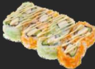
115. California Uramaki D,C 8,9€ Surimi, Avocado und Rogen mit Mayo 12