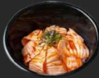
102. Sake Aburi Don D,F