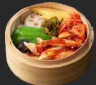
106. Harasu Kimuchi Cey-Ro D, K

Thunfisch, Chili-mayo, Gurke und Lauchzwiebeln