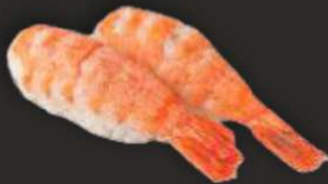
96. EBI B