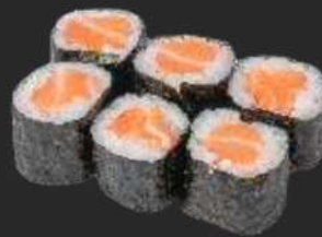
125.Sake Maki D