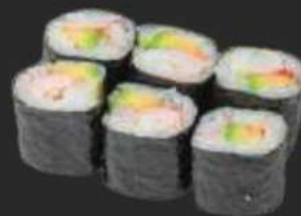
128.California Maki A,D