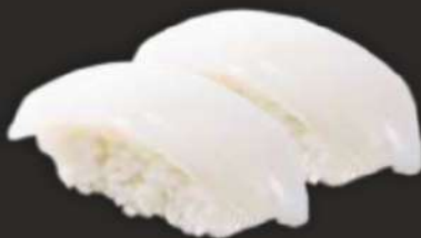
98. IKA N