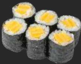
124.Tamago Maki C