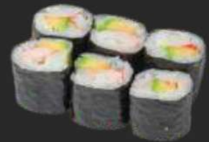
126.Ebi Avocado K,B