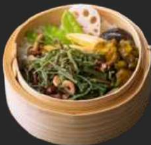
107. Sansai Cey-Ro

Gegrillter Lachs und auf Koreanische Art, scharf eingelegter Chinakohl