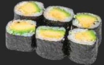
123.Avocado Maki K