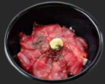
103. Tekka Don D

flambierter Lachs, Frühlingszwiebeln & Unagi-Sauce