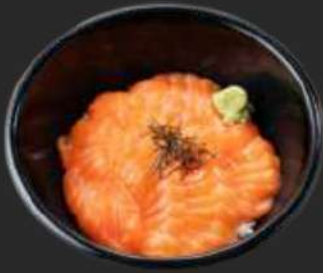
101. Sake Don D

(Diese Gerichte werden als kleine Vorspeisenportion serviert.)