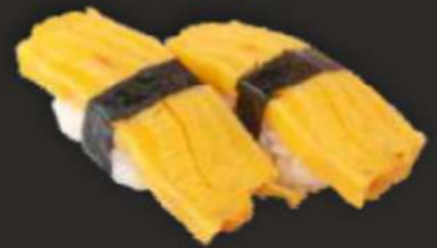
92. TAMAGO C