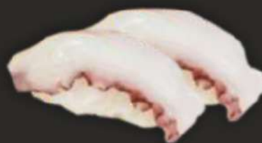
99. TAKO N