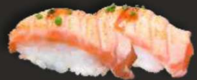
95. SAKE ABURI C, D