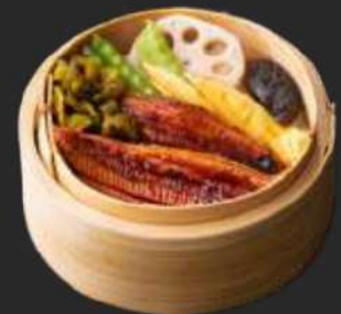
109. Unagi Cey-Ro D, F