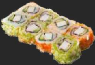
114. California Uramaki D,C 7,9€ Surimi, Avocado und Rogen ohne Mayo 12