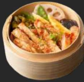
108. Tori Teriyaki Cey-Ro A, F, K