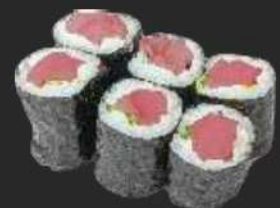
129.Spicy Salmon D