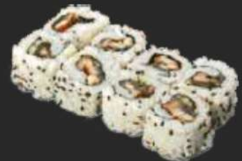
116. Unagi Uramaki D,K,F 9,9€ gegrillter Aal, Gurke, Sesam, Unagi Soße