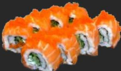
117. Sake Masago Uramaki D,G 10,9€ Gurke, Frischkäse, und Lachs mit Rogen