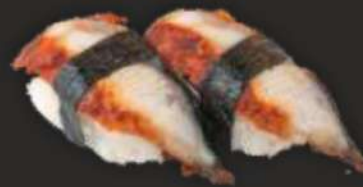
97. UNAGI D, F