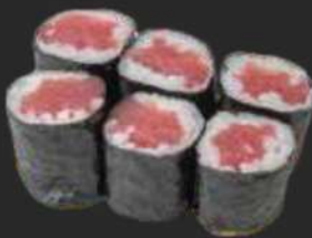
127.Tekka Maki D