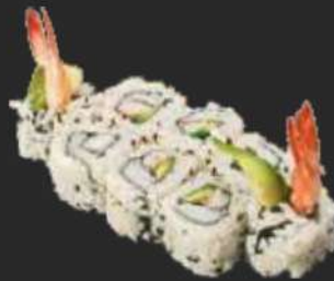
112. Ebi Avocado Uramaki B,K 9,9€ gekochte Garnelen, Avocado, Sesam